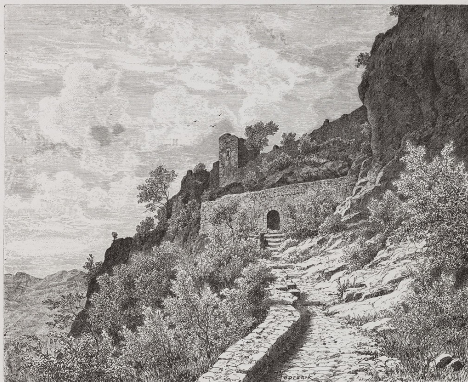
Eingang des Castell de Març.